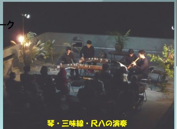
琴・三味線・尺八の演奏