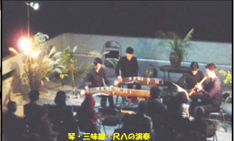
琴・三味線・尺八の演奏

■日 時： 2016年 9月24日(土) (A) 18:30 ~20:00, (B) 19:00 ~20:30, (C) 19:30 ~21:00, (D) 20:00 ~21:30