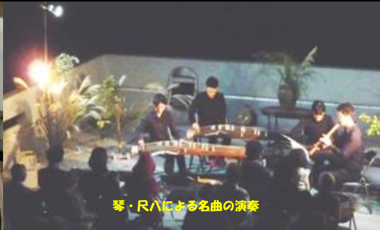
琴・尺八による名曲の演奏

■日 時: 2017年 9月 23日(土・祝日) (A) 18:30 ~20:00, (B) 19:00 ~20:30, (C) 19:30 ~21:00, (D) 20:00 ~21:30 ■会 場: 京都大学大学院理学研究科 花山天文台 ■内 容: ★ 45cm屈折望遠鏡で琴座の環状星雲を観望