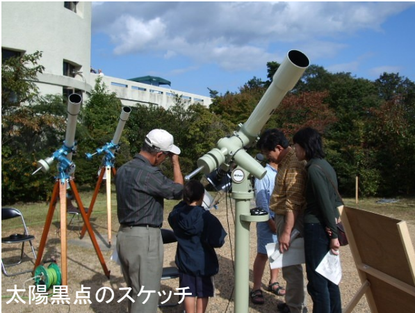
太陽黒点のスケッチ