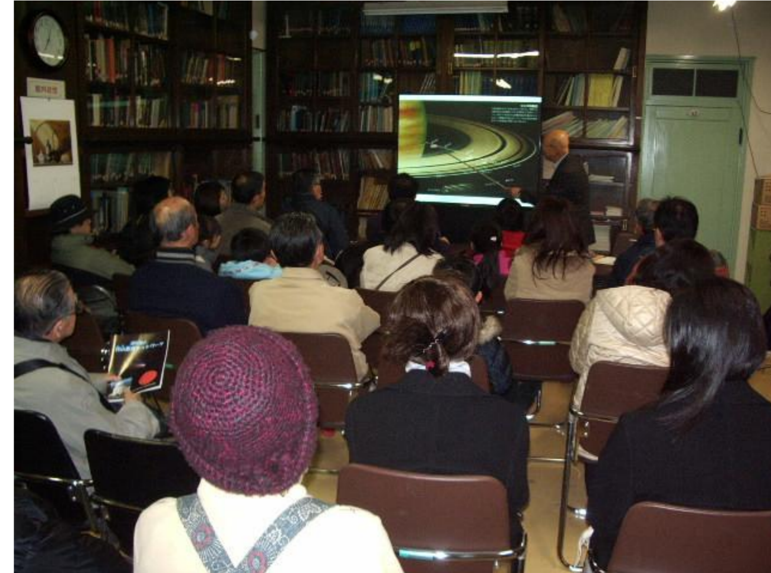
宇宙に関する講演