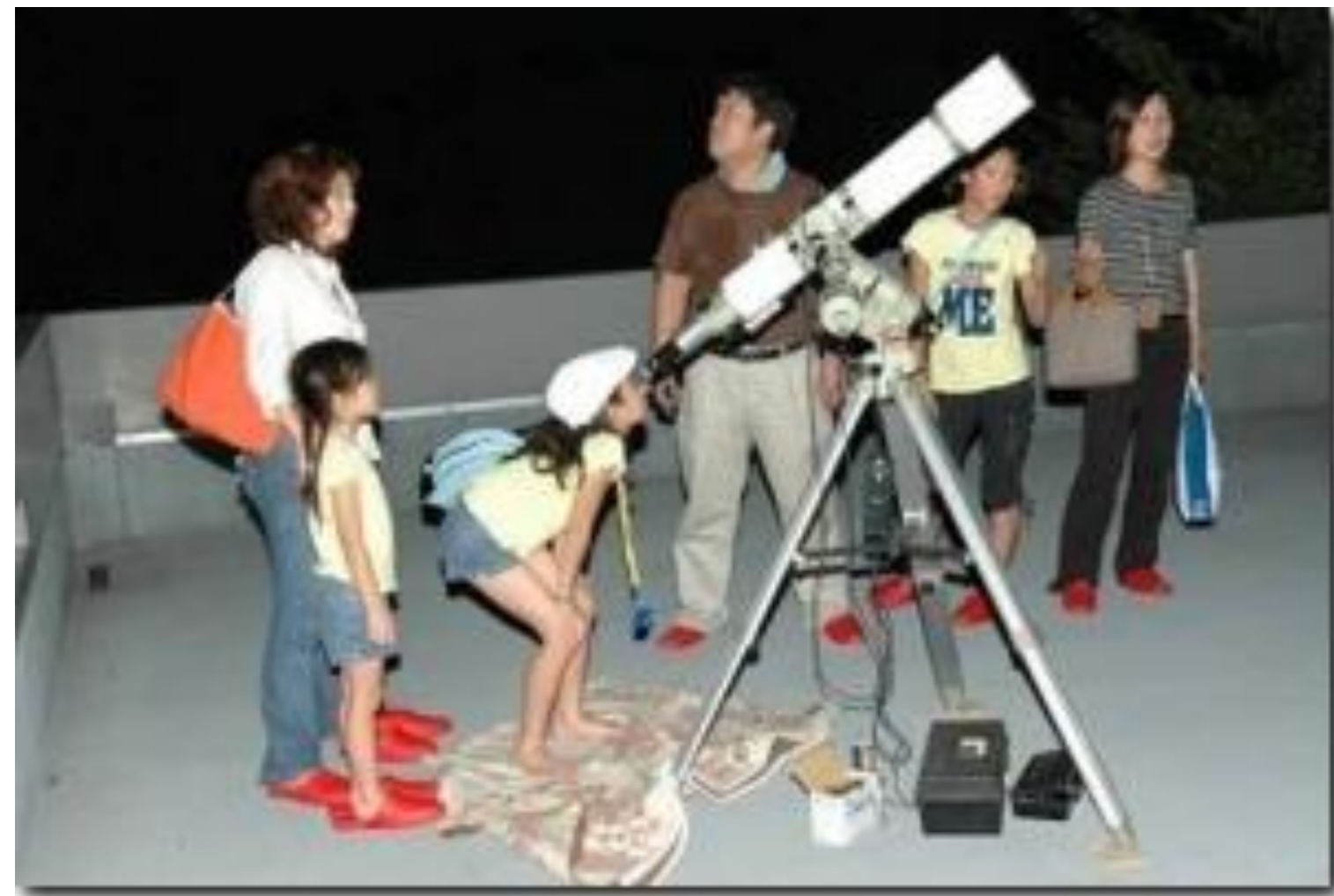
花山天文台の望遠鏡による天体観望

また、その結果として、青少年の理科教育や多くの市民の生涯学習に寄与することを目的としています。事務局は京都大学花山天文台内に置かれています。