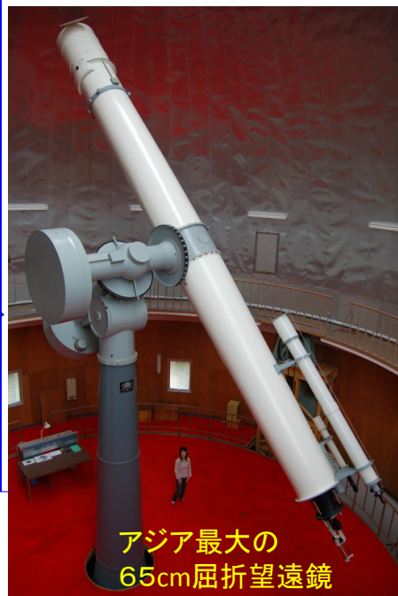
アジア最大の 65cm屈折望遠鏡