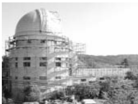
外壁塗装中の本館