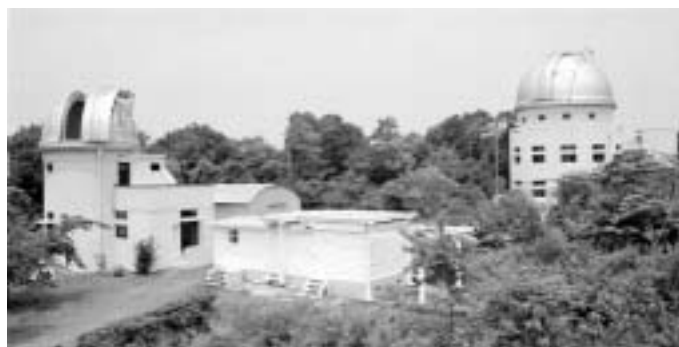
改修工事の終わった 別館・子午線館・本館(左より)