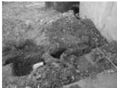
(左) 太陽館地下の配管の様子