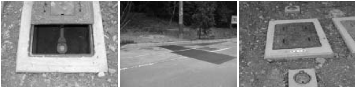
メーター取付工事終了