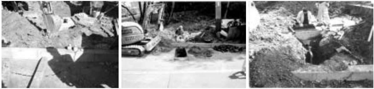
メーター取付工事の様子