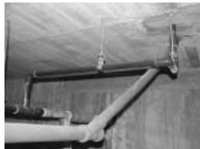
(右) 太陽館玄関横の配管の様子