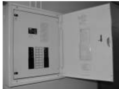
太陽館分電盤の様子