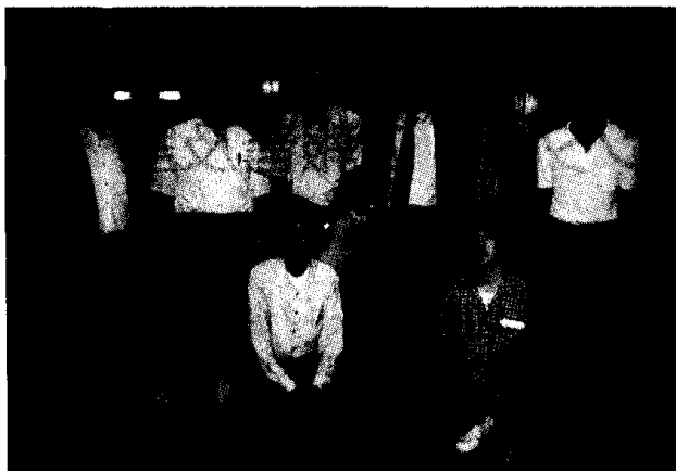
写真1 天文台MHDおたくの若者達とパーカー博士 (木曾路にて夕食後)