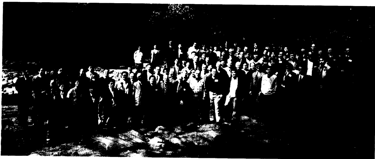
Fig. 2 Univ. Tokyo Symposium 2000 on Magnetic Reconnection in Space and Laboratory Plasmas (MR2000)の全体写真(東京大学山上会館, 中央左に Parker, 右に Petschek)