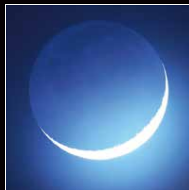
8月3日と同じ月齢の月

問い合わせ: info@kwasan.kyoto https://www.kwasan.kyoto-u.ac.jp/education/Saturn_2019.html