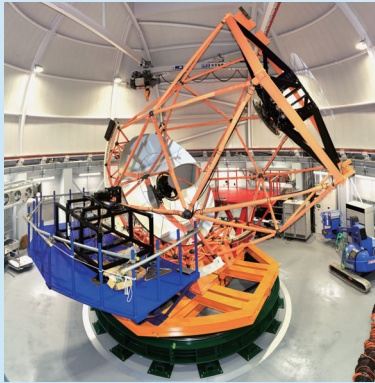
写真：京都大学岡山天文台・せいめい望遠鏡

京都大学岡山天文台では、2018年にアジア最大級となる口径3.8mの「せいめい望遠鏡」が完成しました。今回の特別企画では、せいめい望遠鏡でせまる天文の謎についてお話しします。また、岡山天文台で行われる記念式典をパブリックビューイングで中継します。