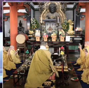
醍醐寺 (Daigoji) 声明

真言宗醍醐派総本山。京都市伏見区。国宝五重塔をはじめ数々の国宝・重要文化財を蔵する。声明は、仏教の儀式などに用いる古典の声楽。経文に高低・抑揚や節をつけたもので、歌詞を梵語のまま歌う「梵讃」、漢語に翻訳した「漢讃」、日本語の「和讃」や講式・論義などがある。