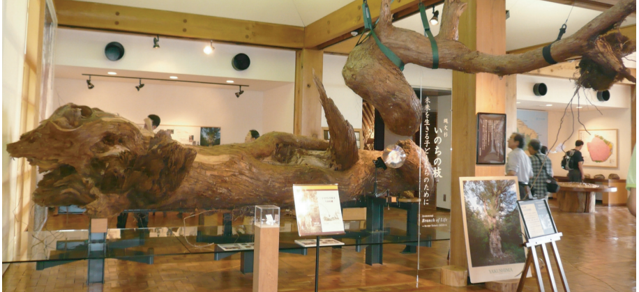
屋久杉記念館で昼食後、安房港へ。再びトッピーで鹿児島港に到着。快晴の(!)鹿児島を恨めしげに飛び立ち、伊丹へと帰着、今回のツアーは無事完了しました。