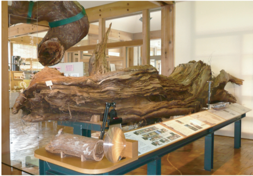
2005年12月、 積雪のために落下した縄文杉の枝