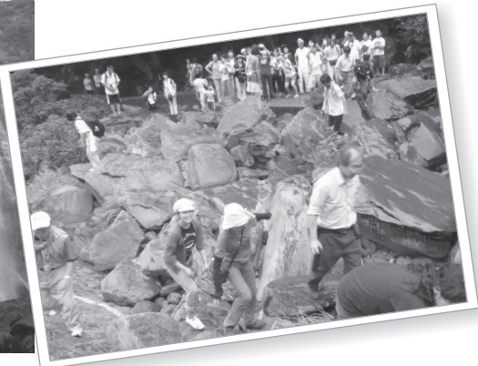
中間ガジュマル園