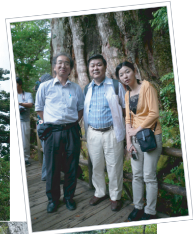
ツアー参加の皆さんと記念撮影