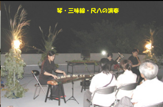
琴・三味線・尺八の演奏