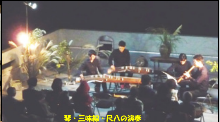
琴・三味線・尺八の演奏