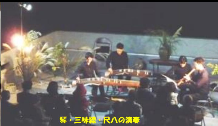
琴・三味線・尺八の演奏

■日 時: 2019年 9月14日(土) (A) 18:30~20:00, (B) 19:00~20:30, (C) 19:30~21:00, (D) 20:00~21:30 ■会 場: 京都大学大学院理学研究科 花山天文台