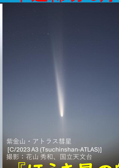
紫金山・アトラス彗星 [C/2023 A3 (Tsuchinshan-ATLAS)]