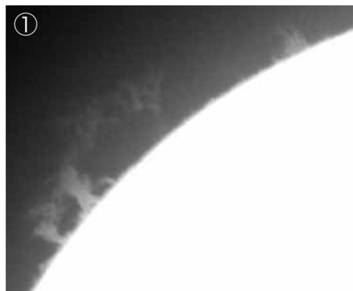
①太陽プロミネンス（2022年9月15日） ②中規模フレア（2021年11月2日） 別館：18cm屈折ザートリウス望遠鏡。晴天時には、リアルタイムの太陽画像を観察できます。