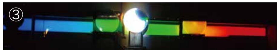
③太陽スペクトル（虹） 太陽館： 70cm シーロスタット望遠鏡