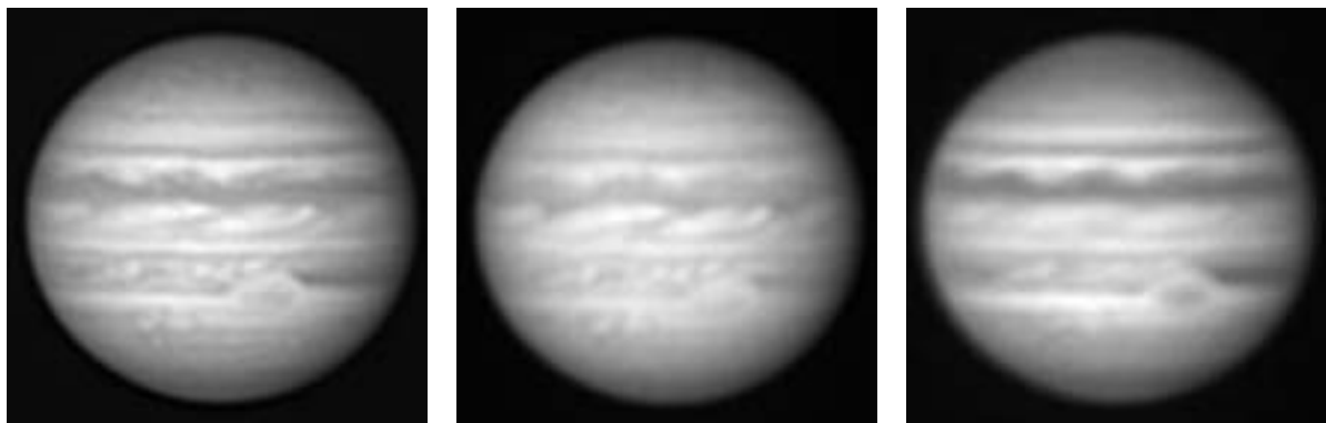
図1: 1999年9月9日、飛騨DSTで撮影。左、白色光。中、赤色光。右、青色光。 (浅田正記)